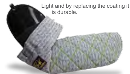
Light and by replacing the coating it is durable.

Leicht und durch Austausch des Überzuges länger haltbar. Leder Unterteil mit kurzem Überzug, als Motivationsarm verwendbar.